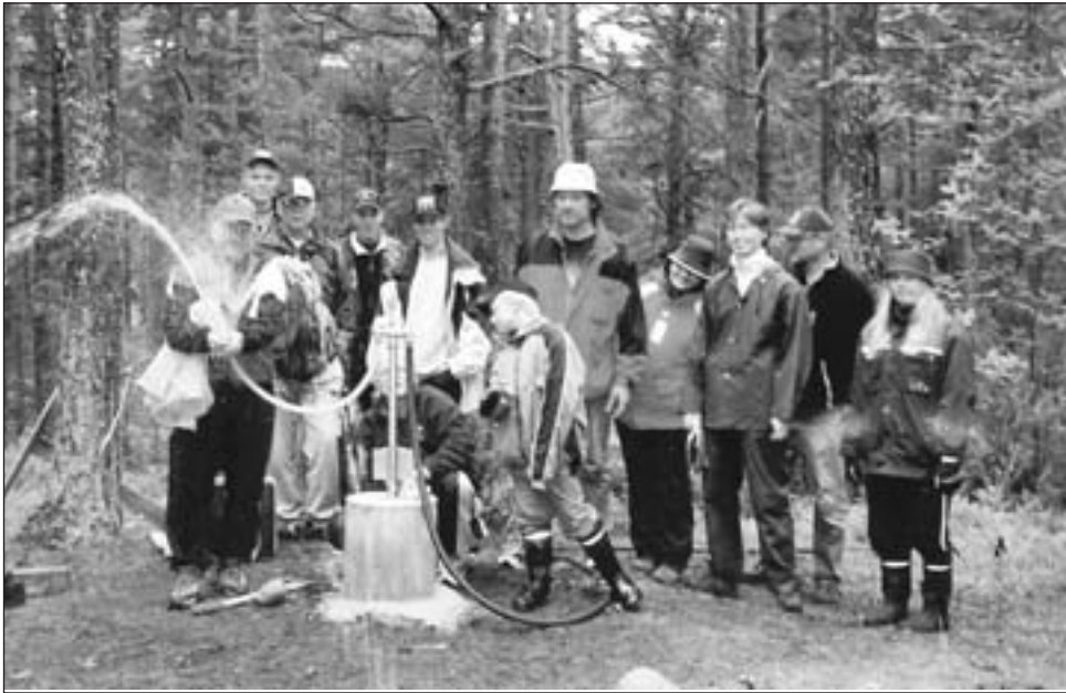
Airiston Veneilijöiden VPK harjoittelemassa.