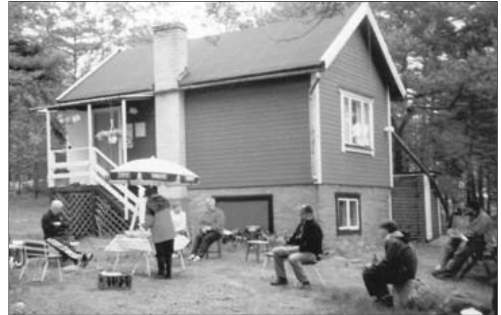
Talkoitten jälkeen ruokailtiin ”ulkona”.