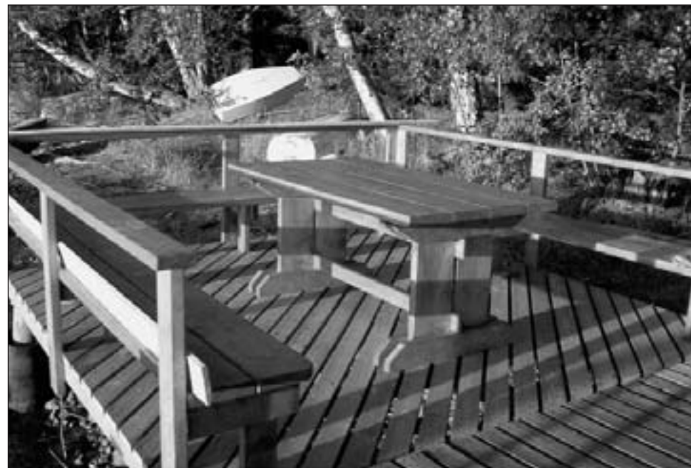
Björkholman "aamiaispöytä" on todella upea.

Saukonojantie 23 20250 TURKU puh. 02-2396 880 www.muovikum.fi