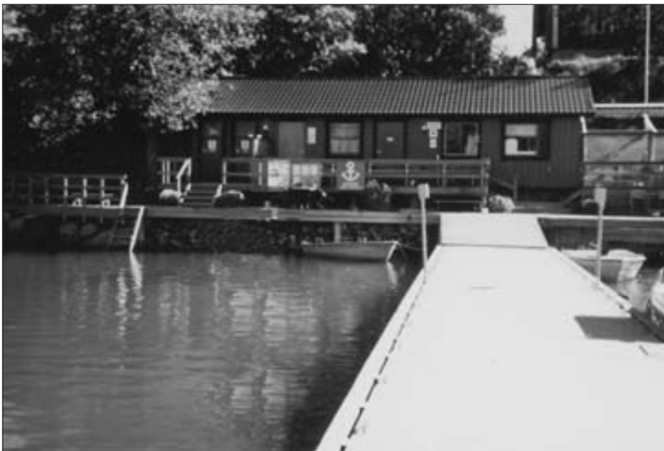
Skagenin satamarakennus on sekä toimiva, että silmälle sopiva.