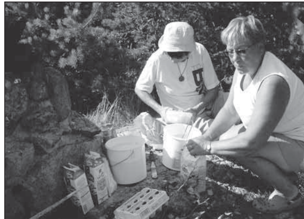
Lettutaikinaa syntyy, kun naisenergia toimii.